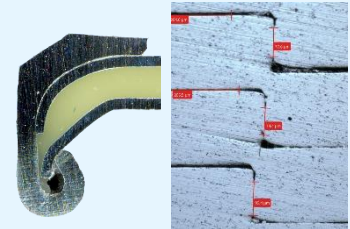
Schliffbilder präparierter Proben

Interessierte haben idealerweise schon Vorerfahrung in der Metallkunde, insbesondere in der praktischen Durchführung von Präparationen und Analysen, allerdings ist dies nicht zwingend erforderlich.